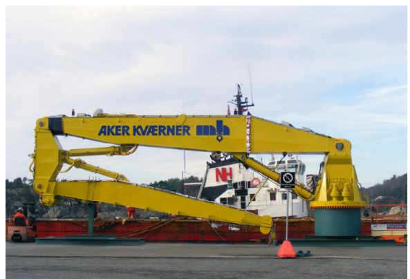
Suwnica obrotowa PDPH dostarczona przez Zamet Industry SA dla Aker MH