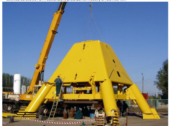
Rama PGB będąca elementem kompleksu urządzeń do podwodnego wydobycia ropy i gazu