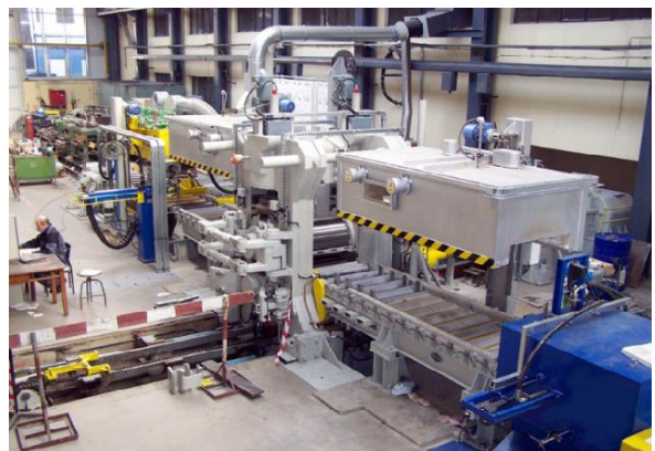
Linia walcownicza do blach stalowych produkcji Zamet Budowa Maszyn SA